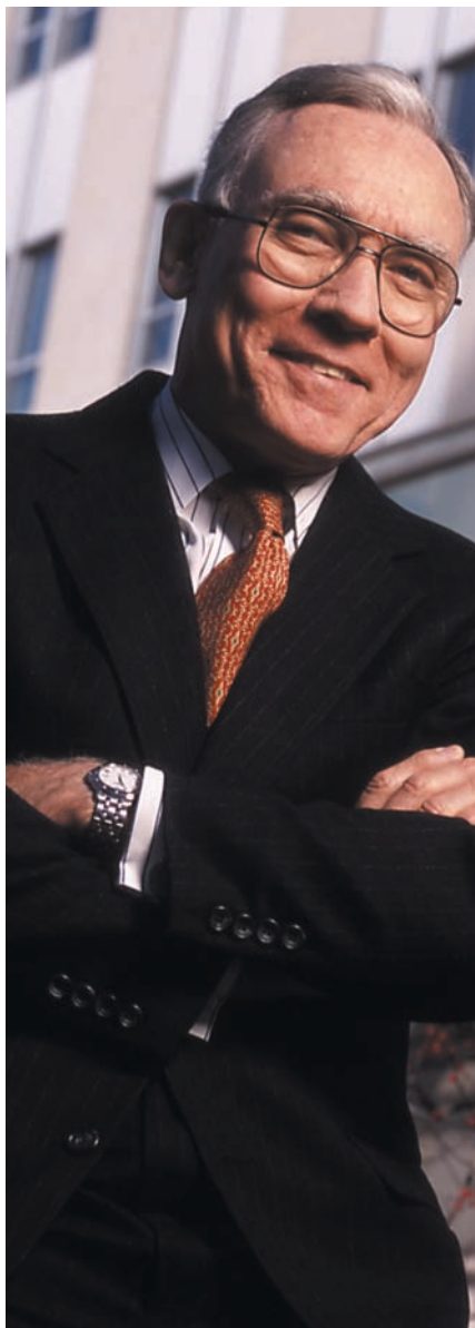
Raymond Baker es director de Global Financial Integrity, un comité asesor con base en Washington que lidera los esfuerzos internacionales para limitar los flujos financieros ilegales y realzar el desarrollo y seguridad global.

ficticios cayó de miles a apenas un puñado. Todavía hay algunos que operan en Europa y Asia, todos los cuales tienen mucho cuidado de asegurarse que sus actividades nunca tocan los Estados Unidos. Es decir, con un trazo de la pluma legislativa, los bancos ficticios fueron virtualmente borrados del sistema financiero fantasma global. Esto se logró a través del ejercicio de la voluntad política.