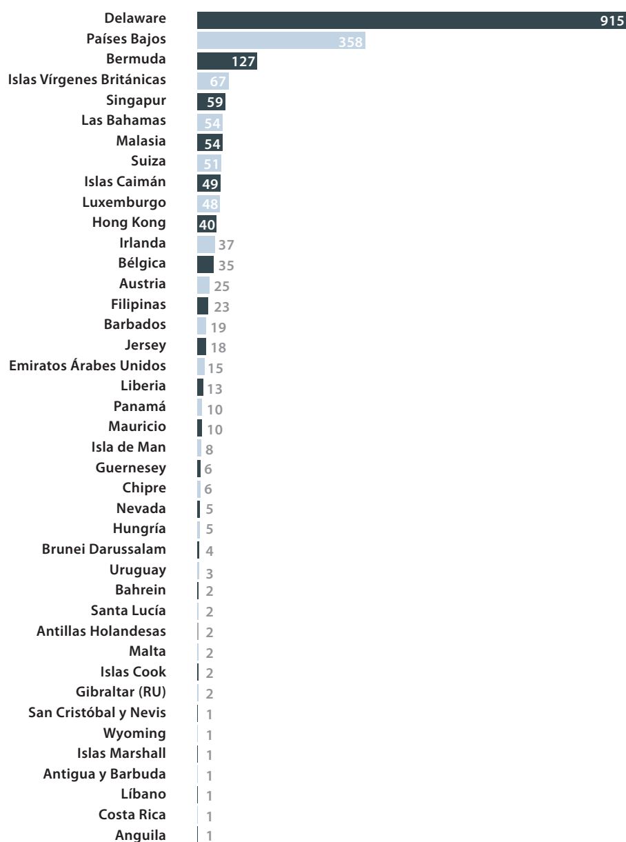
Tabla 4: Las Jurisdicciones Secretas Favoritas de las Subsidiarias de las Industrias Extractivas

En segundo lugar, por un margen amplio similar, están los Países Bajos. Cuando se habla del secreto financiero, los Países Bajos normalmente no se agrupan con los paraísos isleños con sus palmeras o los micro estados alpinos cubiertos de nieve.